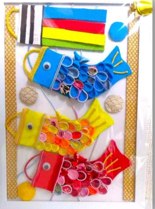
鯉のぼりフレーム飾り