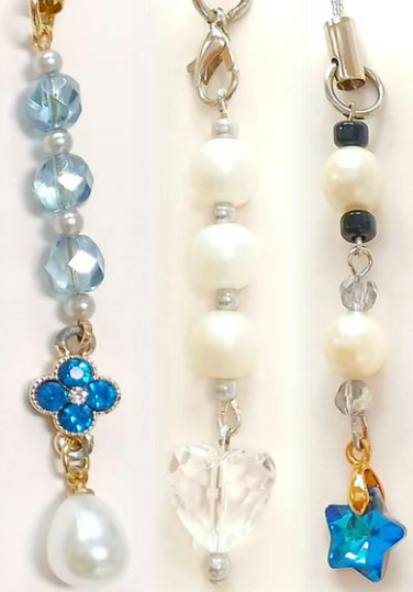
ビーズストラップ

かがやき夢工場は、主に聴覚障害者が集まり「出来ることは何か」を探し、作り、仕事を通じて社会参加の促進と自立を支援する施設です。