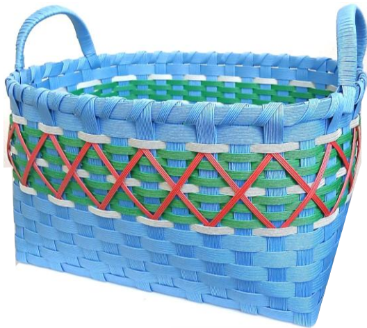
エコクラフト バスケット